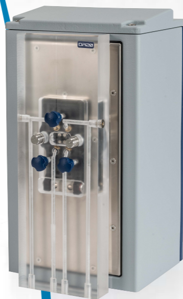
DR20 Refractómetro diferencial