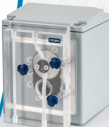
MD12 Presión / Temperatura (Alternativamente MD05 infrarrojo)