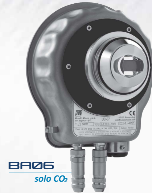
BA06 solo CO 2

conectarse fácilmente al receptor MP06, diseñado para un interfaz fácil de utilizar. El equipo no tiene partes móviles , lo que hace que sea muy resistente y que prácticamente no requiera mantenimiento : asimismo, los nuevos sensores ópticos para la medición de CO 2 se basan en el principio de infrarrojo ATR, que permite eliminar los costes elevados de mantenimiento de los analizadores tradicionales presión/temperatura.