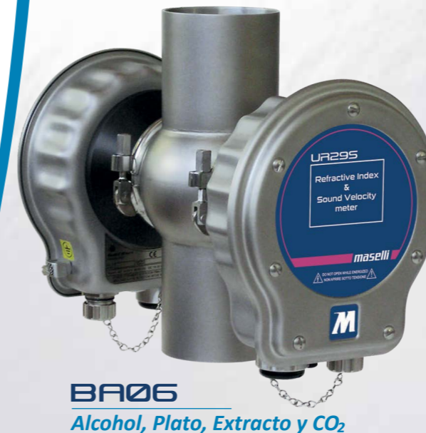
BA06 Alcohol, Plato, Extracto y CO 2