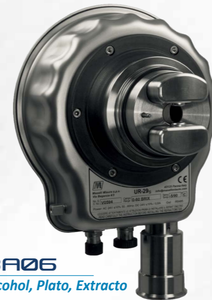
BA06 Alcohol, Plato, Extracto